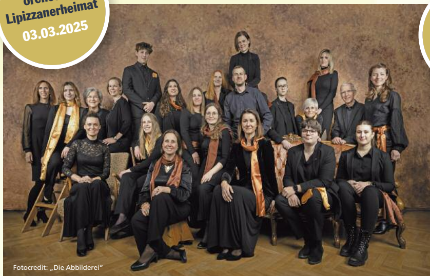
Kammerorchester Lipizzanerheimat 03.03.2025