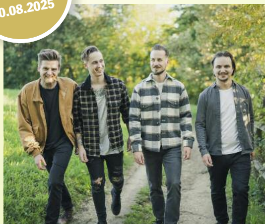
„SCHATTEN- SPRUNG“ 30.08.2025