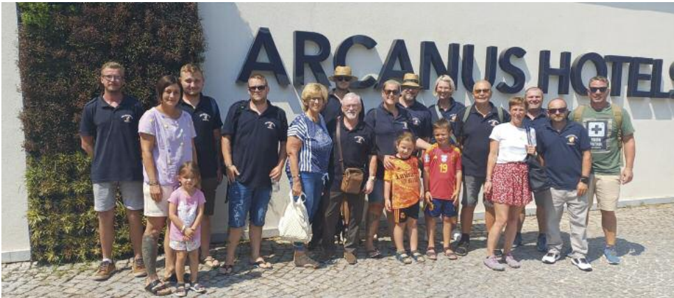
Kameradschaftsurlaub in der Türkei