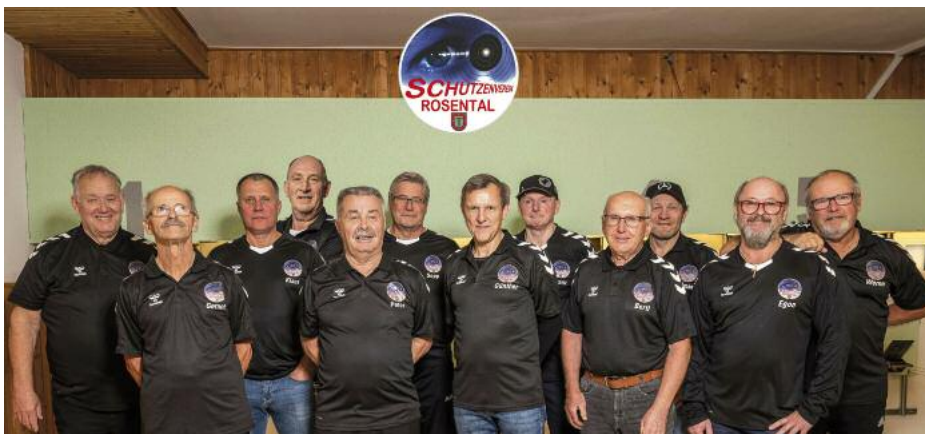
Oberschützenmeister und Schützen im neuen Trikot!

Damit ist für unsere Schützen heuer jedoch noch nicht Schluss. Für sechs bzw. sieben Schützen stehen am 22. November noch die ASKÖ-Bundesmeisterschaften in Wels und am 30. 11. die Teilnahme am 4-Länderkampf in Klosterneuburg auf der Liste.